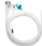
Circuito paciente VITAE®40 Desechable pediátrico Ref.: 4200893