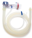
Circuito paciente VITAE®40 Reutilizable adulto Ref.: 4200897

Pack 10 Filtros bacterias-virus (HMEF) – un solo uso - pediátrico _____ 4100501 Pack 10 Adaptadores vía aérea para IRMA CO 2 - neonato _____ 4100503