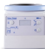
MR850 Humidificador/calentador + sensor temperatura + cable calentador + adaptador a barra Ref.: 0500540