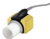
Capnografía (Analizador CO 2 main-stream): IRMA CO 2 , adaptador vía aera para IRMA y monitorización CO 2 Ref.: 4200802