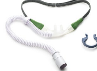
Pack 10 Gafa nasal alto flujo Talla L Ref.: 4200044