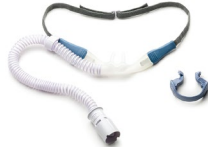
Pack 10 Gafa nasal alto flujo Talla M Ref.: 4200042