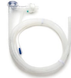
Circuito paciente VITAE®40 Desechable pediátrico Ref.: 4200893