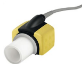
Capnografía (Analizador CO 2 main-stream): IRMA CO 2 , adaptador vía aera para IRMA y monitorización CO 2 Ref.: 4200802