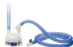
Pack 10 kit de circuito Optiflow para MR850 con cámara de humidificación Ref.: 0500544