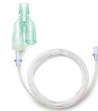
Kit oxigenoterapia y capnografía Ref.: 4200811