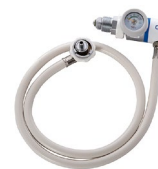
Regulador de oxígeno (P-300 P40 – Con conexión rápida) (*) Ref.: 5501XXX

(*) Consulte con nosotros todas las opciones disponibles.