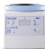
MR850 Humidificador/calentador + sensor temperatura + cable calentador + adaptador a barra Ref.: 0500540