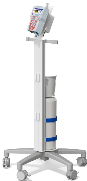
Carro para VITAE®40 Accesorios (no incluidos): AC/DC, botella hasta 7L Ref.: 4200860