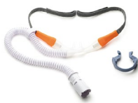
Pack 10 Gafa nasal alto flujo Talla S Ref.: 4200040