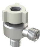
Distribuidor doble válvula DISS Ref.: 4200980